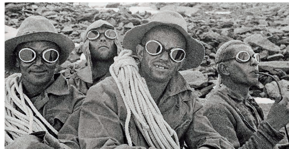
Les frères Abalakov

Au contraire, des ouvrages d'alpinistes occidentaux ont carrément «inutile» dans leur titre, je pense d'abord aux Conquérants de l'inutile de Lionel Terray. Et c'est peut-être aussi parce que c'est inutile, bien loin de nos tracas quotidiens et de tout ce qu'on fait d'utile (métro-boulot-dodo), que c'est aussi beau.