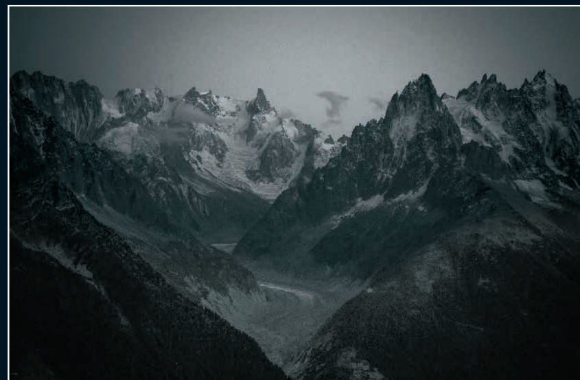
Mer de glace