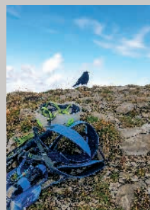
Via ferrata, Tour d'Al