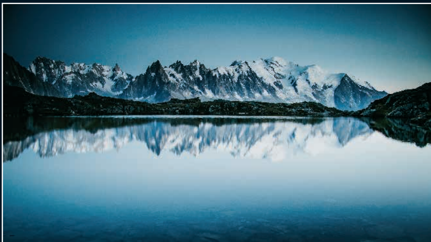
Miroir sur le lac de Chésery