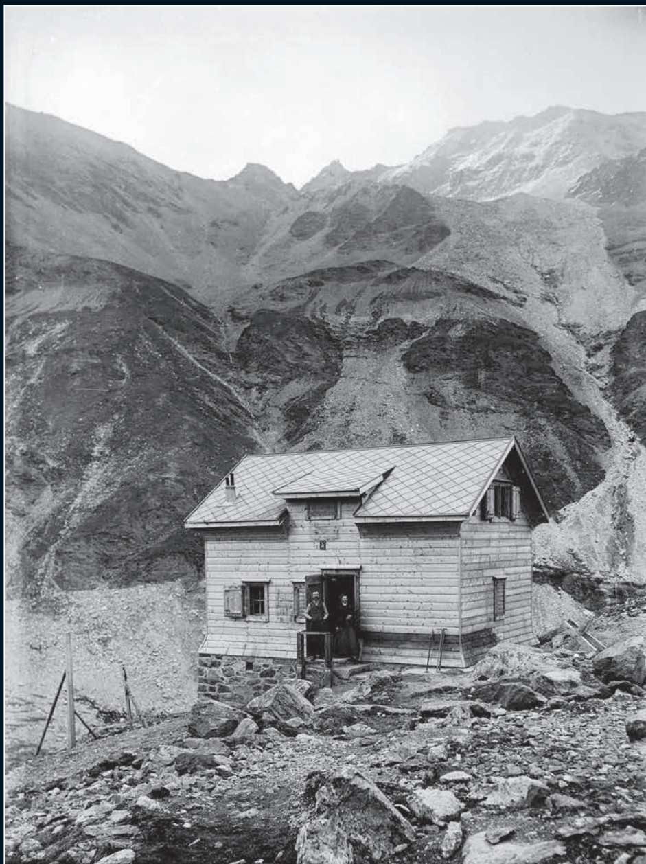
Cabane des Dix, vers 1925