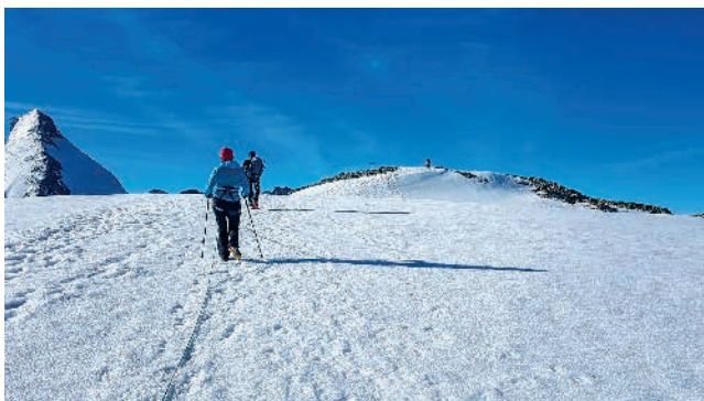
Le sommet de Tête Blanche en vue

Je dois vous avouer qu'il n'est pas facile de bien dormir à plus de 3'500m, cela dit après le petit-déjeuner nous démarrons notre journée à 5h15 avec un lever du jour exceptionnel. Rien que pour cela, on oublie d'avoir compté les moutons presque toute la nuit! La température est clémente et les conditions de neige sont excellentes pour marcher encordés